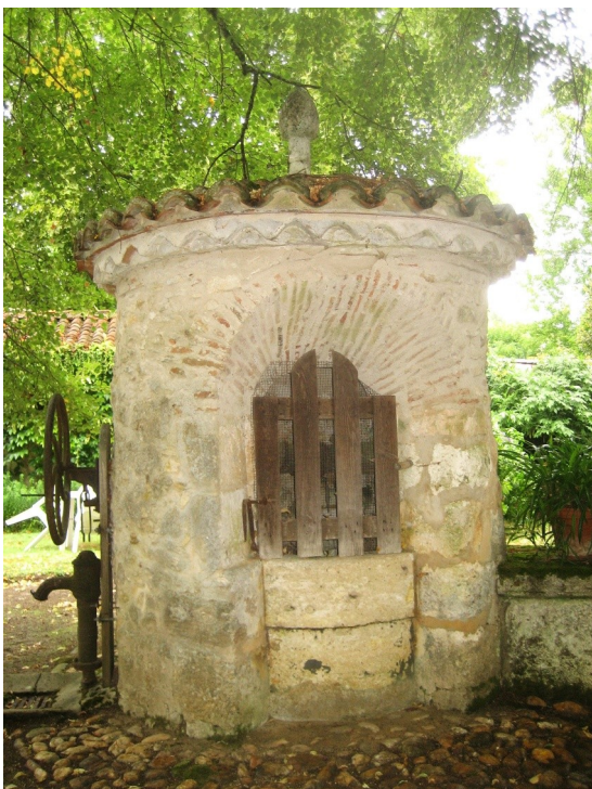
EPI DE FAITAGE