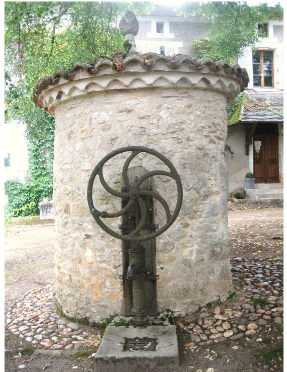
VUE COTE POMPE