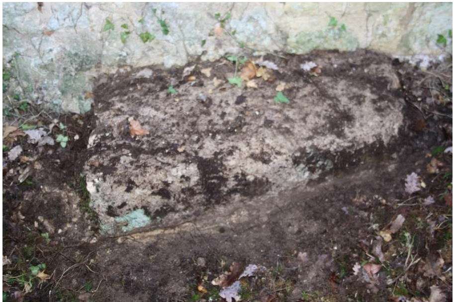
Ancien linteau de la porte ( ? )