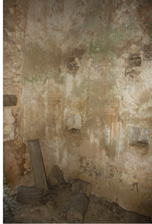
Intérieur (mur est)