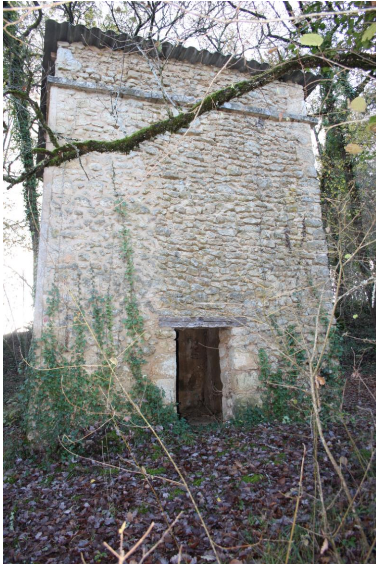
Façade principale (nord)