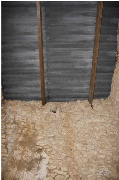
Toiture vue de l'intérieur