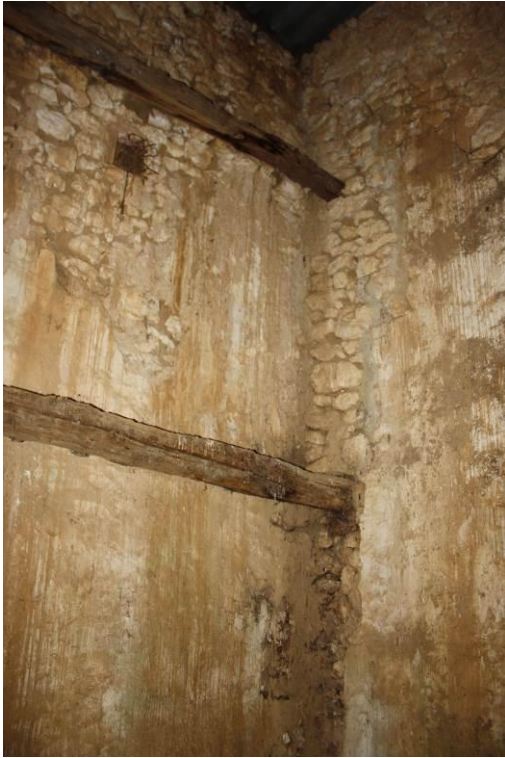
Intérieur (angle sud-ouest)