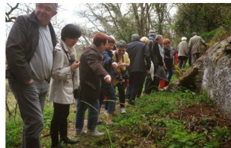
Le groupe s'intéresse à la flore locale