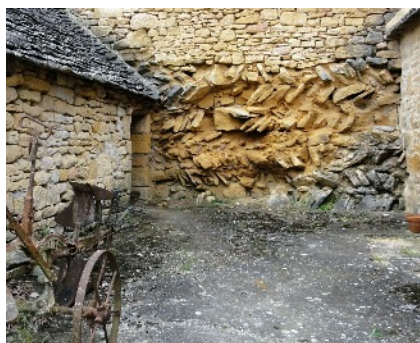
Le mur d'époque mérovingienne