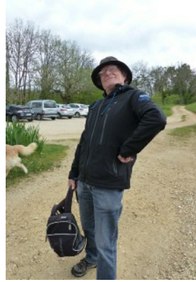
Le guide du jour