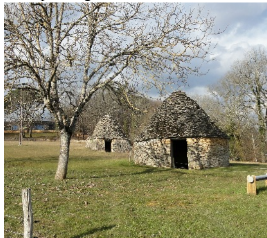
Cabanes près de la ferme auberge