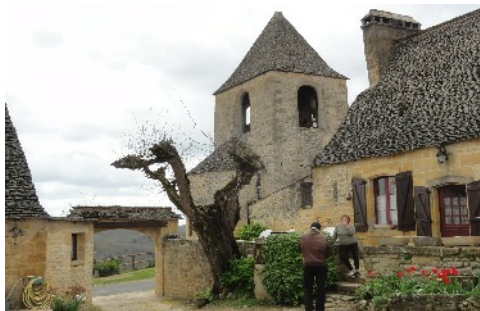
Tamniès médiéval - Eglise St Cybard