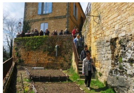
Descente dans le jardin du curé