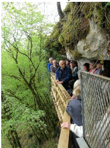
Accès au cluzeau