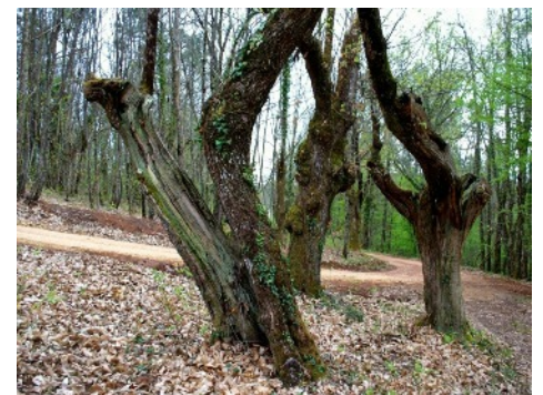
Vieux châtaigniers toujours en exploitation