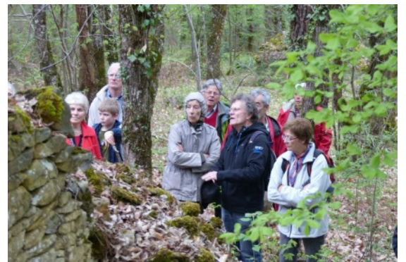
Devant une cabane