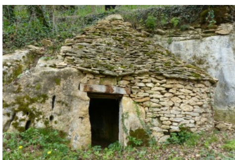
La cabane semi-troglodytique