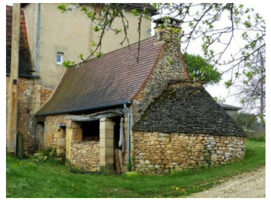
Four à pain