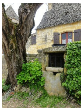
Le puits de la famille Laborderie