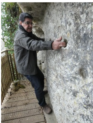
Imaginez, sans la passerelle !