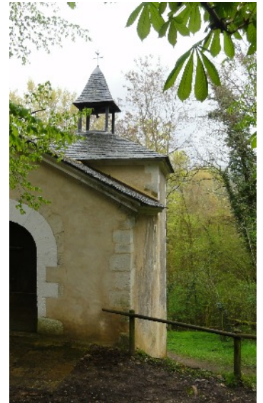
la Chapelle des Bois