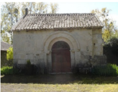
Chapelle St Blaise

Au lendemain de la Saint Blaise Souvent l'hiver s'apaise.