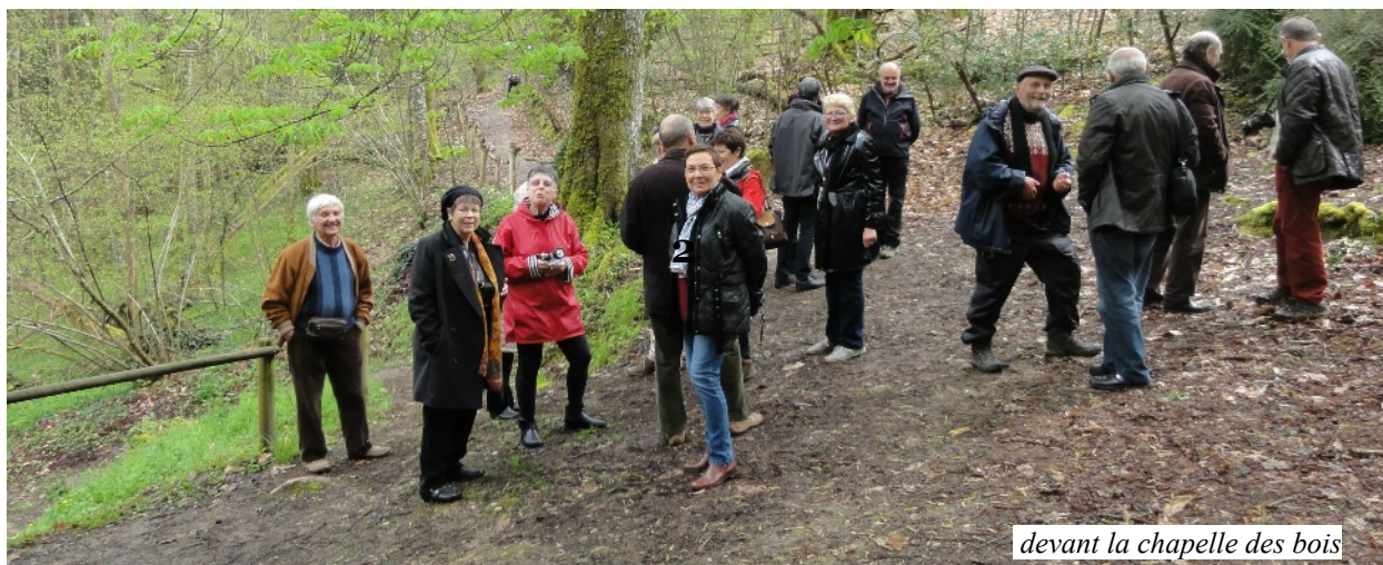
devant la chapelle des bois