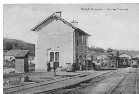
gare de Vergt