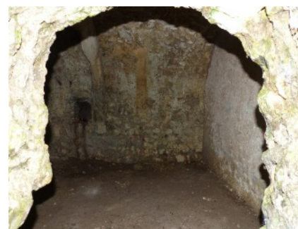
la « grotte »