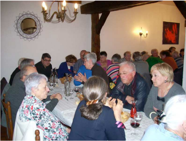
Une vue du repas

Après le repas, le groupe est allé visiter le petit patrimoine de Vergt, sous la conduite de Jean Grelley,