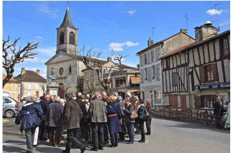
Le groupe autour de la stèle à la mémoire du capitaine Malafaye