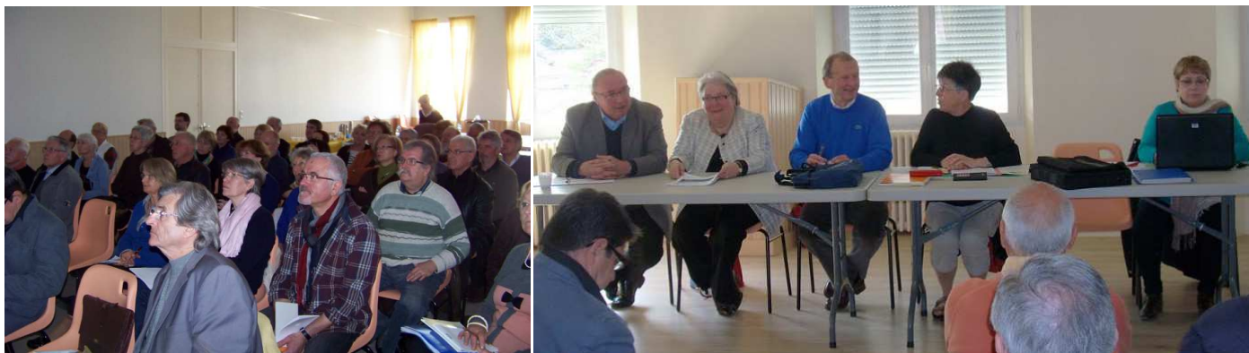
Une vue de la salle