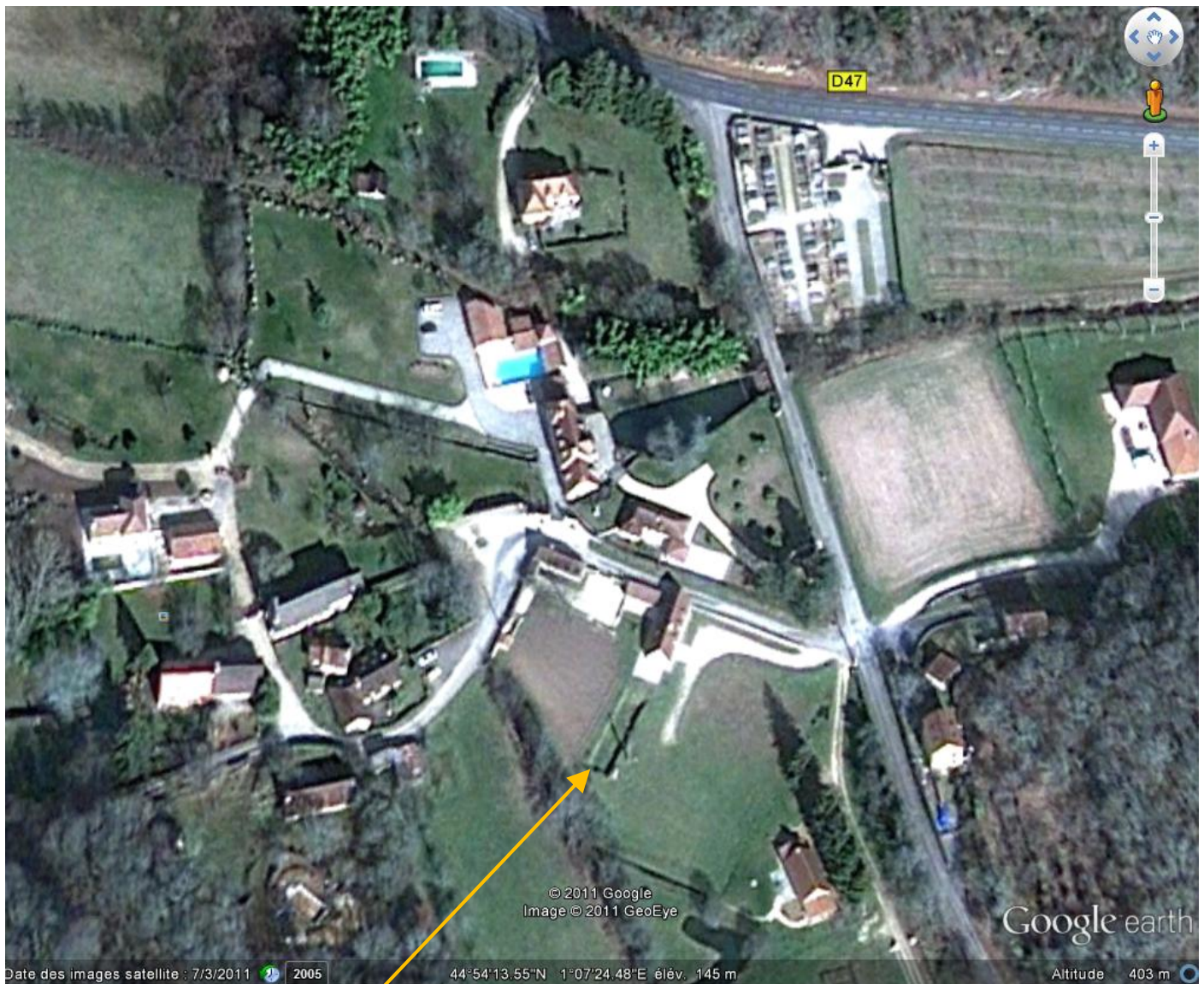
Image satellite d'Allas le vieux ou Allas l'Évêque